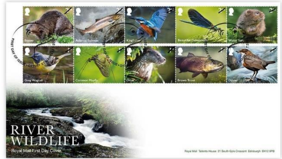
已蓋銷首日封連郵票(BR494) $140.00