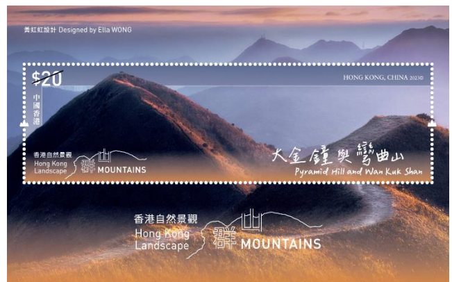
郵票小型張 (嵌有一枚 20 元郵票)