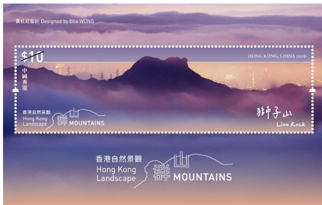
郵票小型張 (嵌有一枚 10 元郵票)