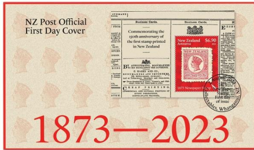
已蓋銷首日封連郵票(NZ344) $45.00