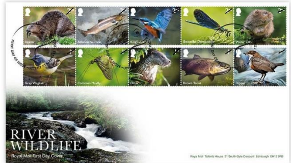
已蓋銷首日封連郵票(BR494) $140.00