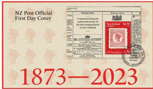
已蓋銷首日封連郵票(NZ344) $45.00