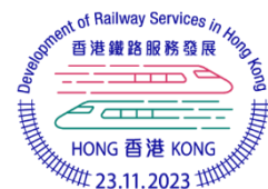
彩色郵戳 (彩色郵戳直徑: 32 毫米)