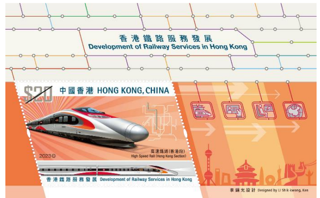
郵票小型張 (嵌有一枚 20 元郵票)