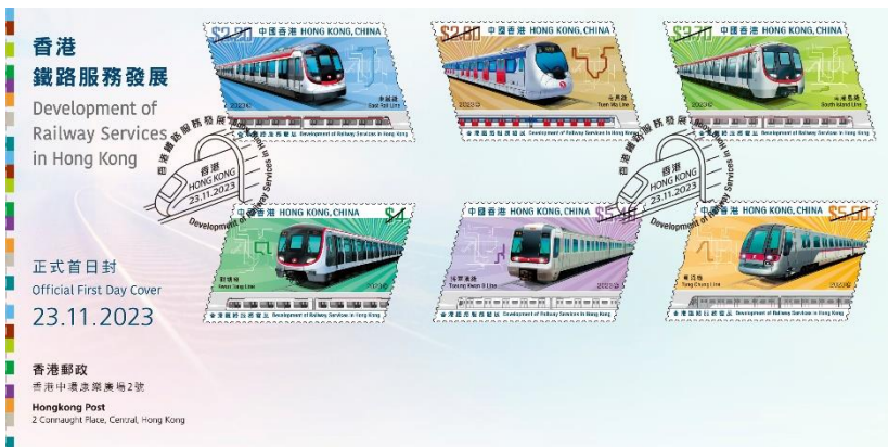
貼有一套六款面值郵票的已蓋銷首日封 (以相關的特別郵戳蓋銷)