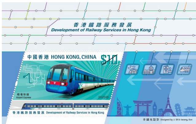
郵票小型張 (嵌有一枚 10 元郵票)