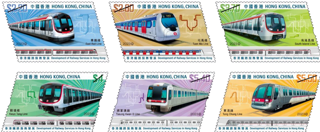
郵票 (一套六款面值)