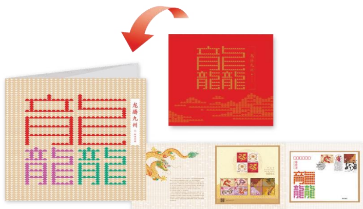
紀念套摺（珍藏版） (封面)