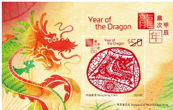
50元鐳射剪紙郵票小型張