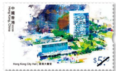
郵票 (一套六款面值)