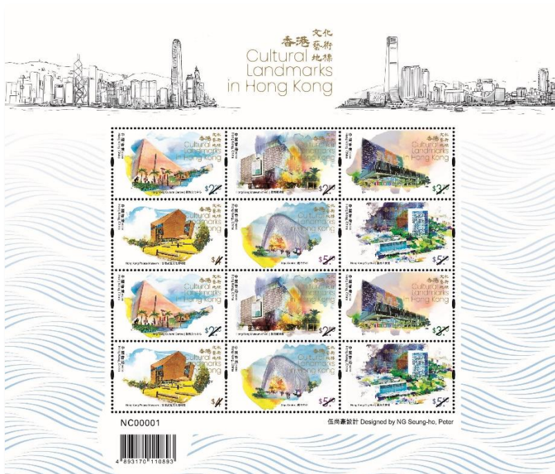
小版張（嵌有兩套郵票）

各郵政局會於二〇二三年八月二十二日設置收集點，方便市民遞交需要人手蓋印服務的正式首日封／紀念封／自製封。