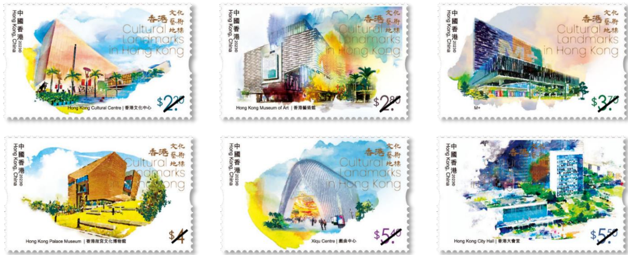
郵票 (一套六款面值)