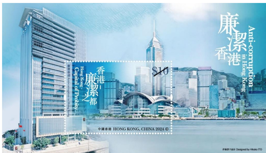
郵票小型張（嵌有一枚10元郵票）