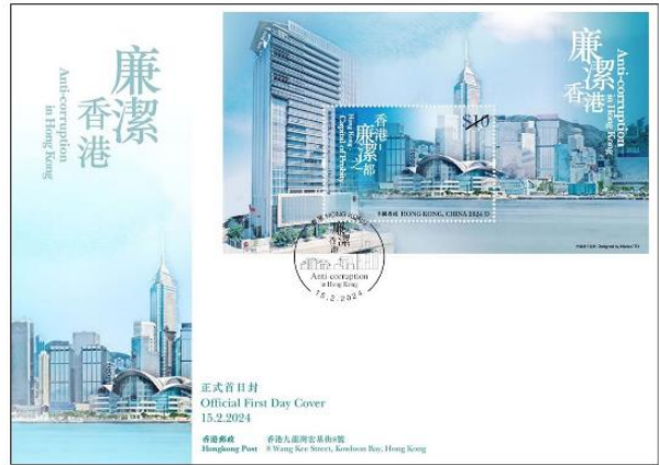
貼有一張 10 元郵票小型張的 已蓋銷首日封 (以相關的特別郵戳蓋銷)