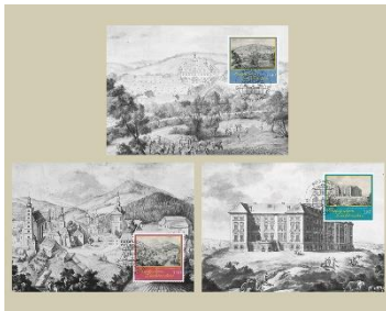
極限明信片一套三張(LI178) $80.00