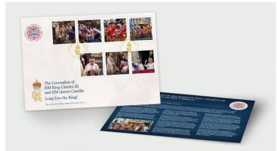
已蓋銷首日封連郵票(IM202) $140.00