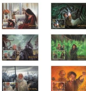
郵票小型張一套六張(NZ346) $120.00