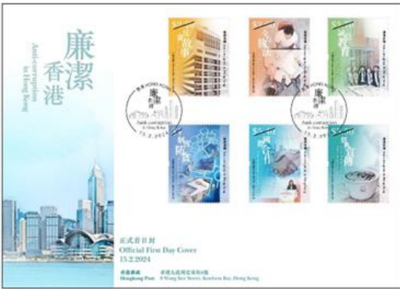
貼有一套六款面值郵票的 已蓋銷首日封 (以相關的特別郵戳蓋銷)