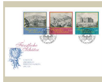
已蓋銷首日封連郵票(LI179) $55.00