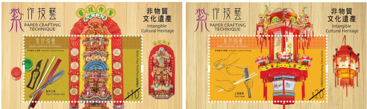
非物質文化遺產－紮作技藝

註：所有圖像只供參考。各套郵票的主題、發行日期、郵品種類、價格、設計及形式或會更改，並於發行前公布。