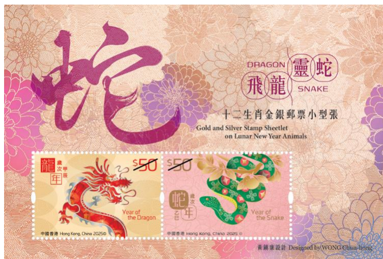
十二生肖金銀郵票小型張 — 飛龍靈蛇