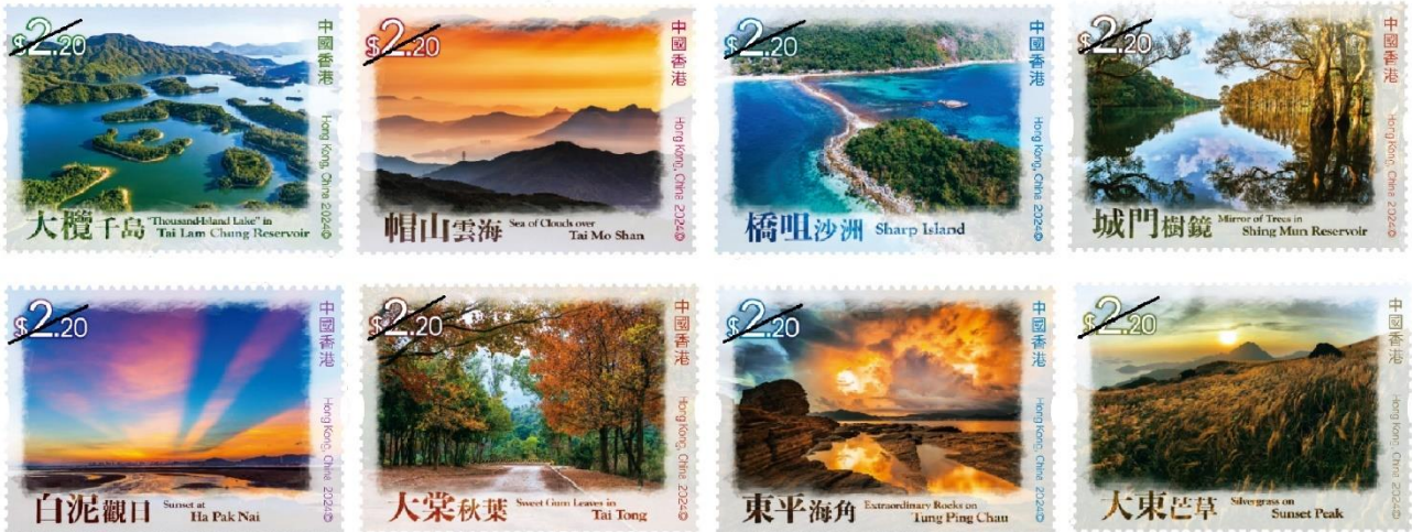
郵票（一套八枚，各 2.2 元）