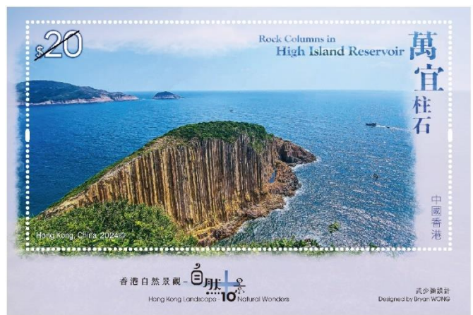
20 元郵票小型張（壓印）