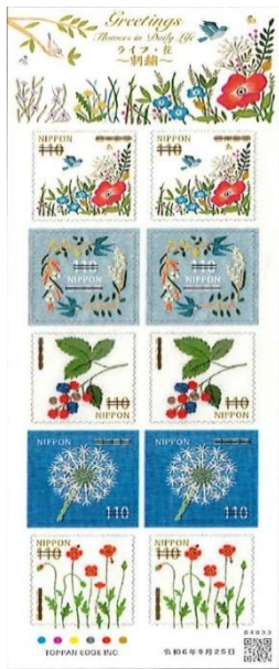
小全張 (JP018) $70.00