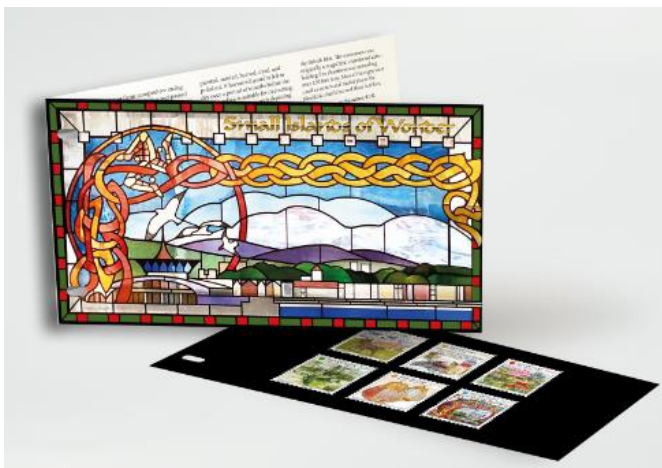
套摺 (IM208) $150.00