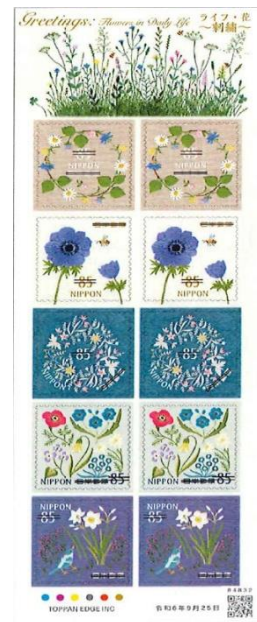
小全張 (JP019) $55.00