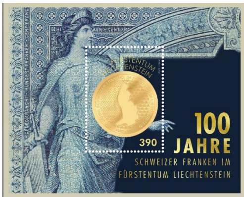
郵票小型張 (LI185) $45.00