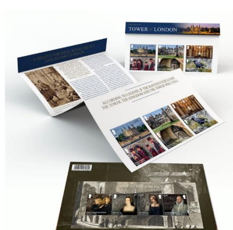
套摺 (BR504) $270.00