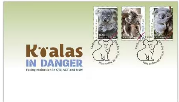
已蓋銷首日封連郵票 (AU548) $35.00