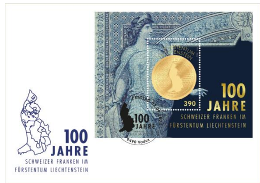
已蓋銷首日封連郵票小型張 (LI186) $55.00