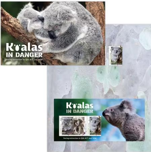
套摺 (AU547) $60.00