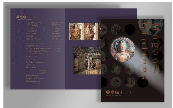
套摺 (CH216) $35.00