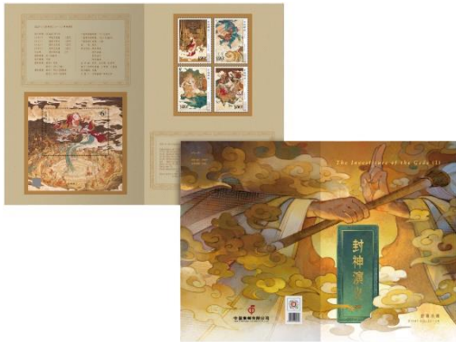
套摺 (CH215) $35.00