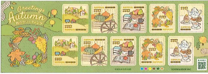
小全張 (JP016) $70.00