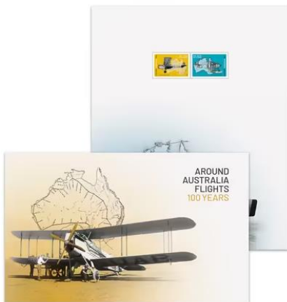
套摺 (AU549) $25.00