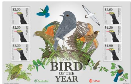
小全張 (NZ354) $120.00