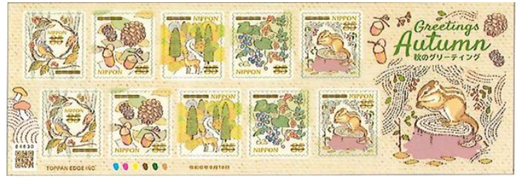
小全張 (JP017) $55.00