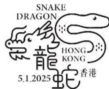
特別郵戳 (特別郵戳直徑: 32毫米)