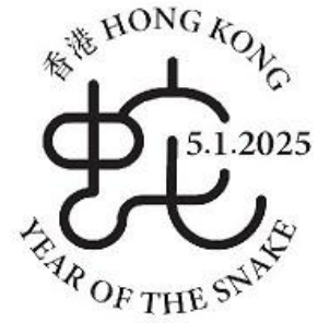
特別郵戳 (特別郵戳直徑: 32毫米)