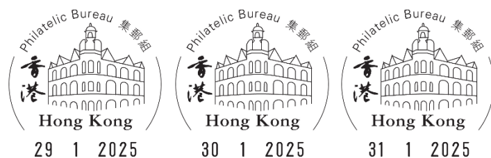
郵戳式樣(只供參考)

由現在至2025年1月23日，顧客可申請本署的「自行設計紀念封代貼郵票/蓋銷服務」，在其自備紀念封貼上郵票和蓋上2025年1月29日至31日集郵組圖案郵戳。