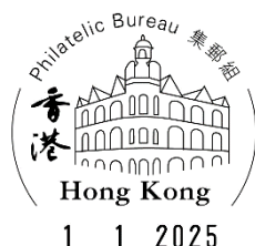
郵戳式樣(只供參考)

由現在至2024年12月31日，顧客可申請本署的「自行設計紀念封代貼郵票/蓋銷服務」，在其自備紀念封貼上郵票和蓋上2025年1月1日集郵組圖案郵戳。