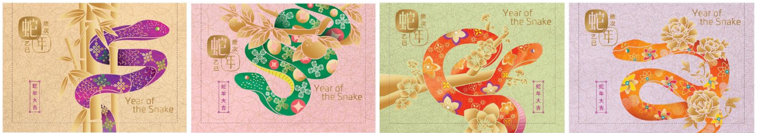
郵資已付生肖賀年卡 (空郵郵資) (一套四張)