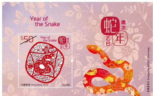
50元鐳射剪紙郵票小型張