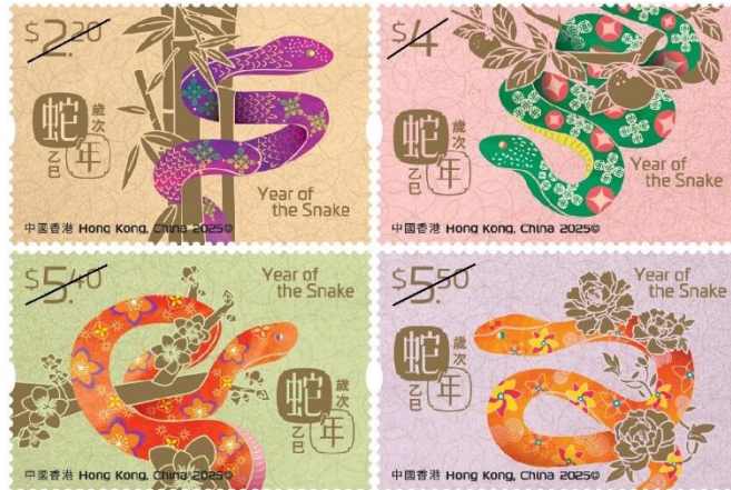
郵票(一套四款面值)