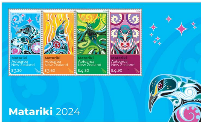
小全張 (NZ350) $85.00