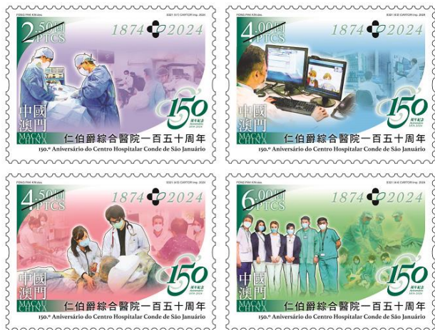
郵票一套四枚 (MA758) $20.00