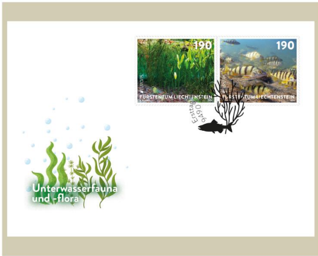
已蓋銷首日封連郵票 (LI183) $55.00