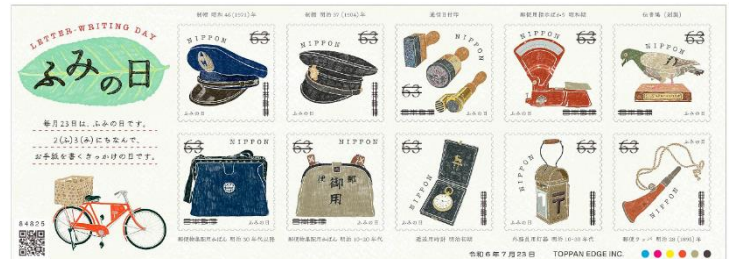
小全張 (JP015) $45.00