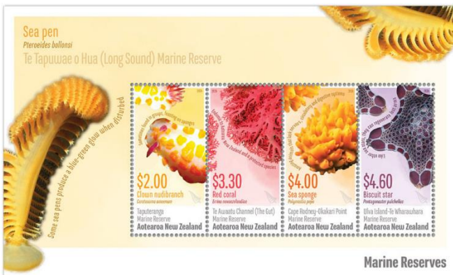
小全張 (NZ352) $80.00