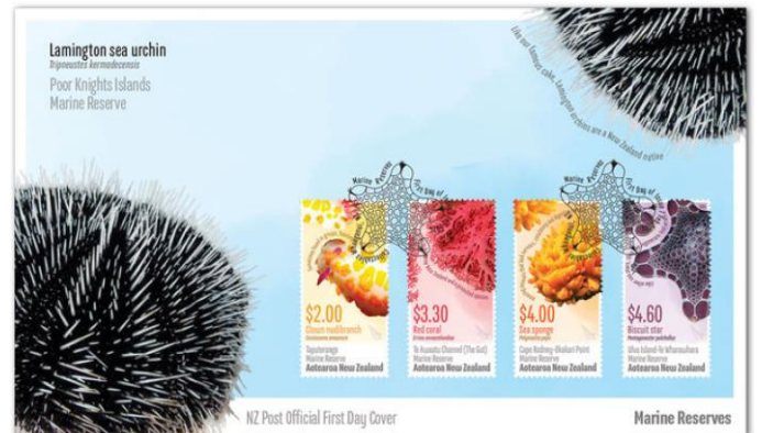
已蓋銷首日封連郵票 (NZ353) $85.00