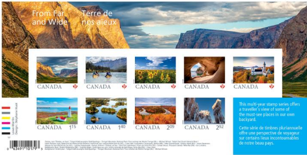
小全張 (CA287) $90.00