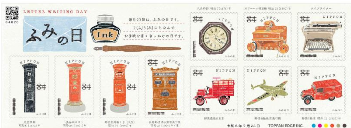
小全張 (JP014) $55.00