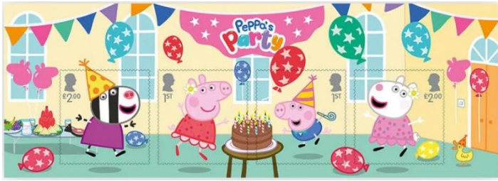
小全張 (BR501) $85.00