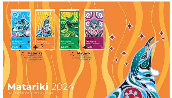
已蓋銷首日封連郵票 (NZ351) $90.00