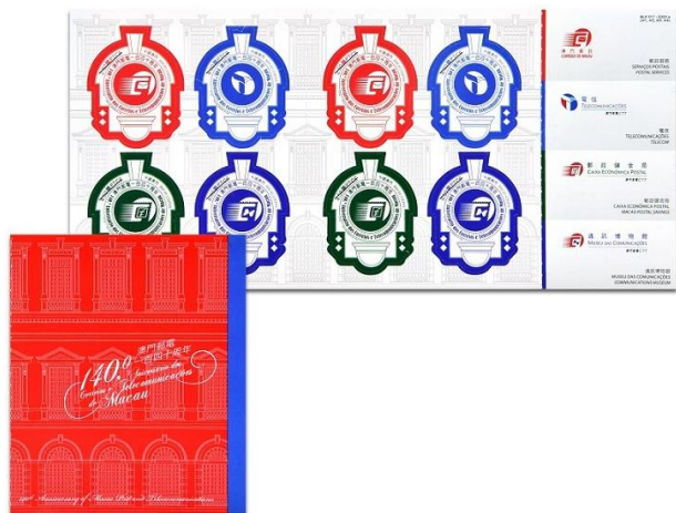
郵票小冊子 (MA760) $40.00