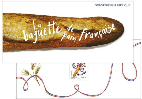
套摺 (FR106) $50.00