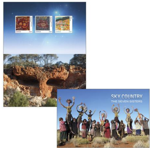
套摺 (AU546) $35.00