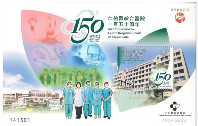
郵票小型張 (MA759) $20.00