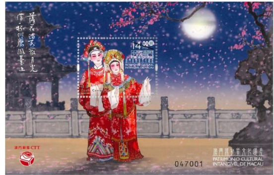
郵票小型張 (MA765) $20.00