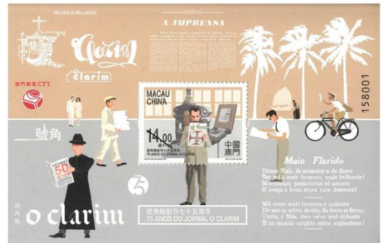
郵票小型張 (MA763) $20.00