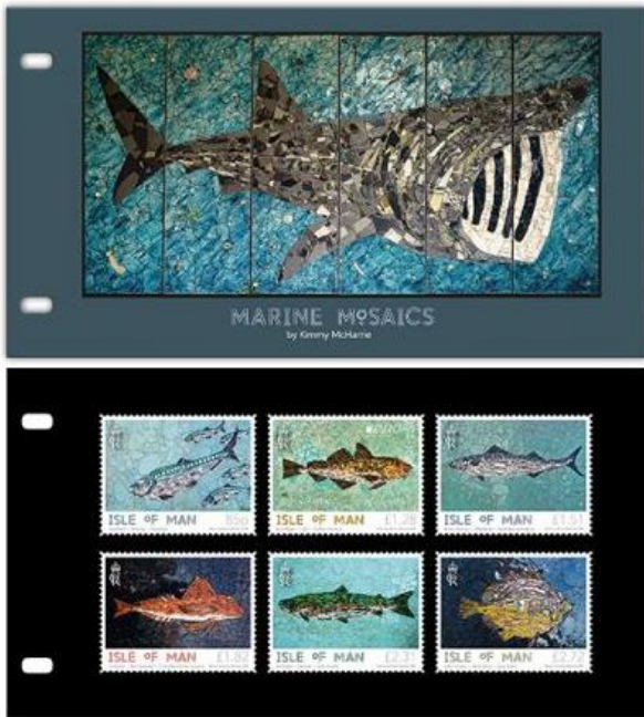
套摺 (IM206) $150.00