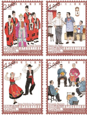
郵票一套四枚 (MA764) $20.00