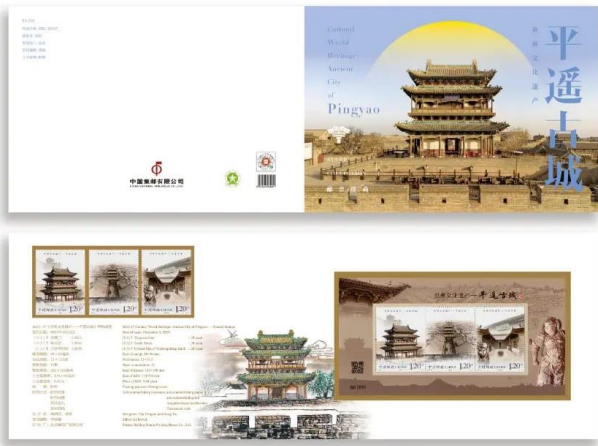
套摺 (CH214) $35.00