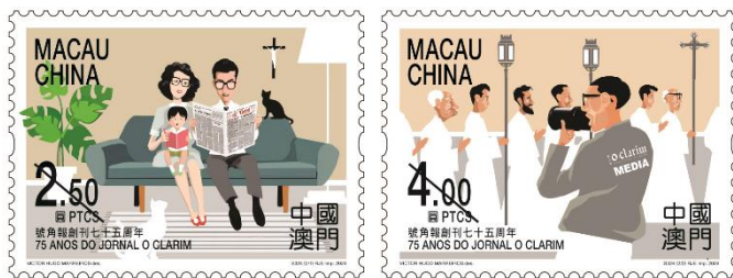
郵票一套兩枚 (MA762) $10.00