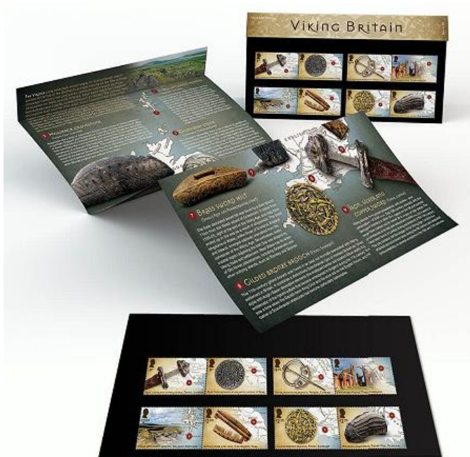
套摺 (BR503) $180.00