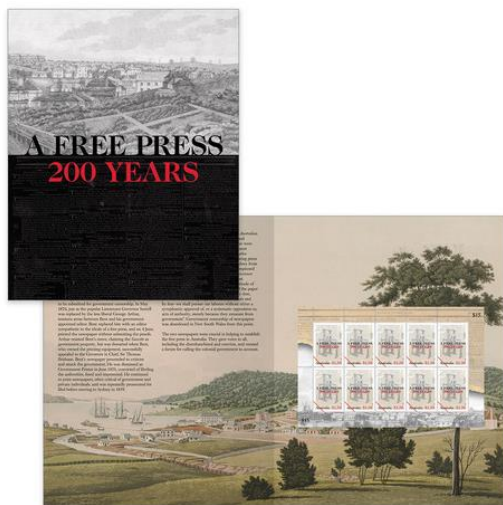
套摺 (AU545) $100.00