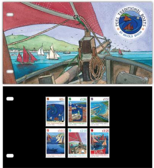
套摺 (IM207) $150.00