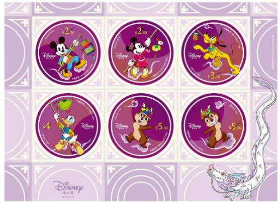
小全張(嵌有一套六枚郵票)