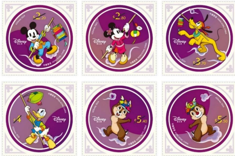
郵票（一套六款面值）