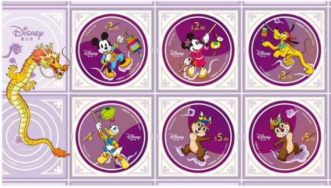
小全張(自動黏貼)(嵌有一套六枚郵票)